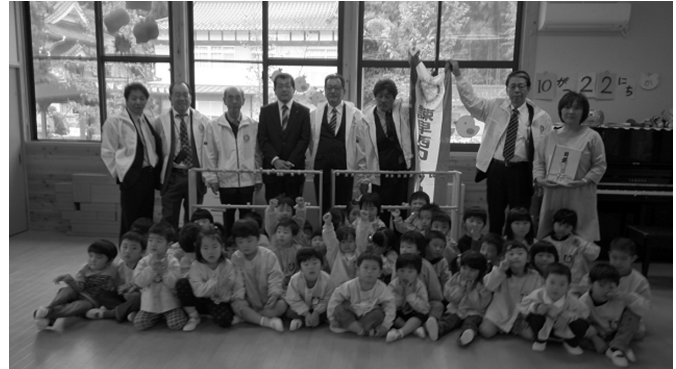
気仙沼より久保会長と会員の方々の中継の様子