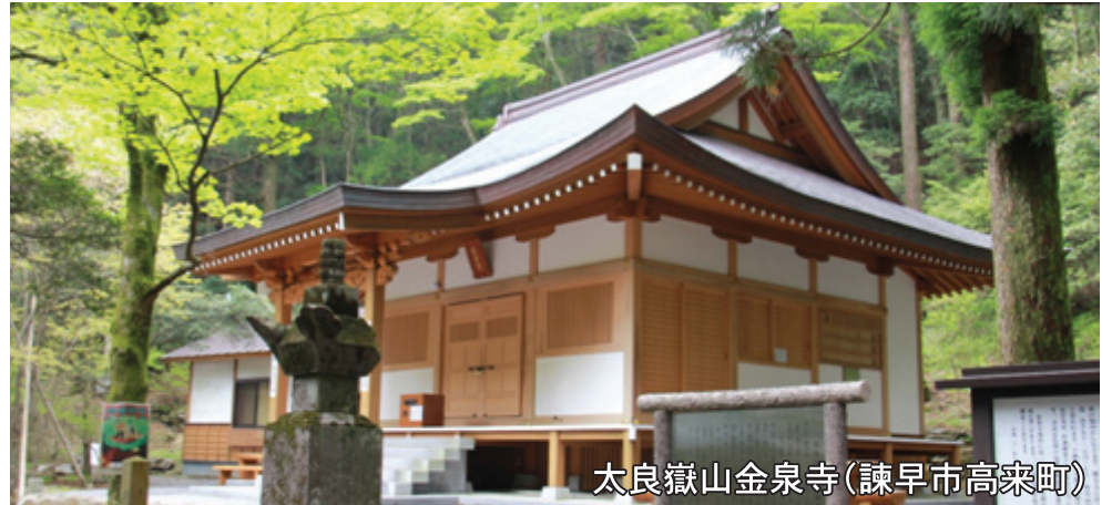
太良嶽山金泉寺(諫早市高来町)